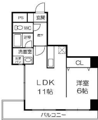
702号室 1LDK (約43㎡)