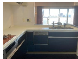
▲食器洗い乾燥機・3口ガスコンロ 使いやすいL字キッチン